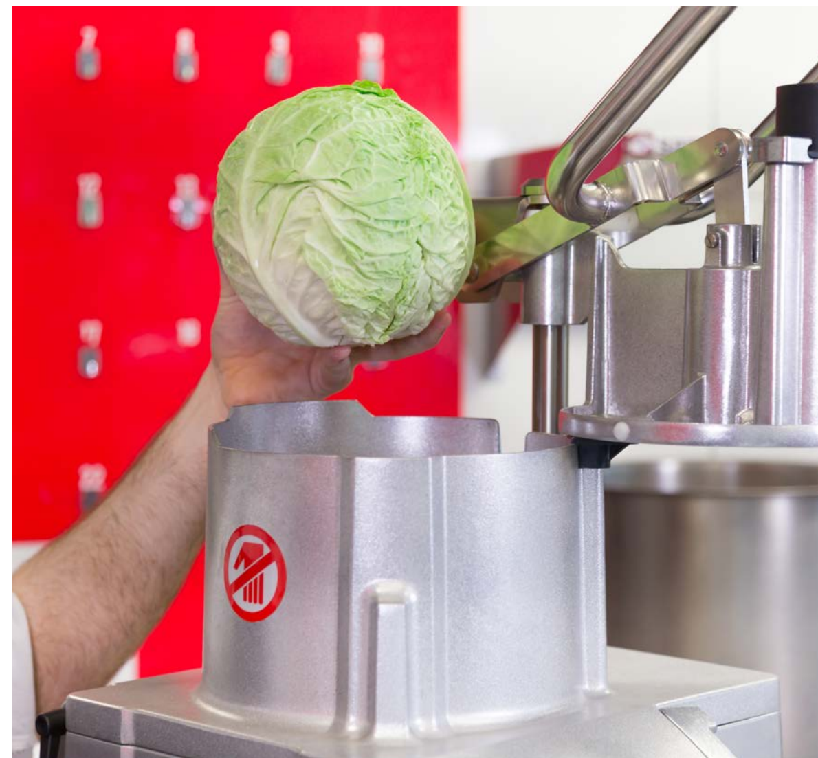
Cabezal de gran capacidad