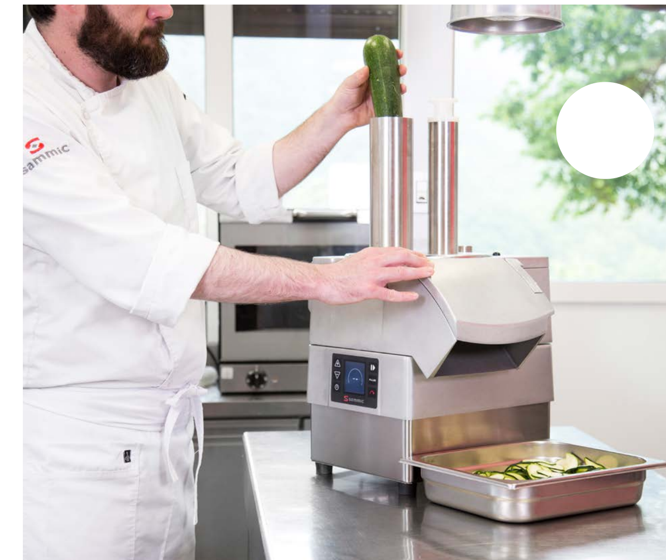
Cabezal de tubos